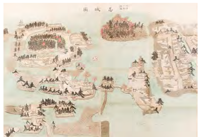
忍城が沼地の中の城郭であることがよくわかる絵図。左上が本丸。御三階櫓(三重櫓)と二重櫓が計3カ所に点在。[忍城鳥瞰図/明治6年調製(行田市郷土博物館所蔵)]

行田市郷土博物館 行田市郷土博物館 検索 埼玉県行田市本丸17-23 TEL 048-554-5911 ●開館時間 9:00~16:30(入館16:00まで) ●入館料 大人200円(160円)、大学・高校生100円(80円)、中学・小学生50円(40円) ※()内は団体割引・20名以上 ●休館日 月曜日(祝日・休日は開館)、祝・祭日の翌日(土・日は開館)、毎月第4金曜日(テーマ展・企画展開催中は開館)、年末年始