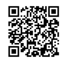
不二頂かんたんレシピのページはこちらから

●不二頂かんたんレシピ https://www.vana4132.jp/recipe/